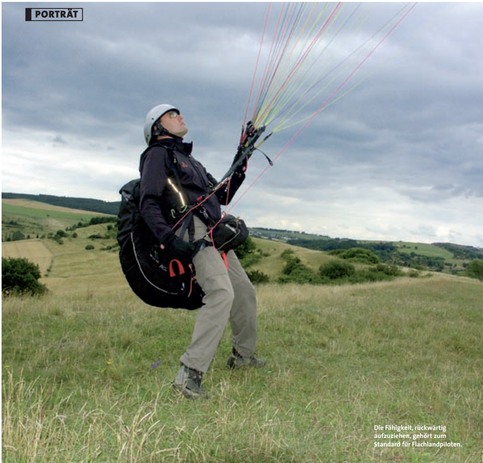
Die Fähigkeit, rückwärtig aufzuziehen, gehört zum Standard für Flachlandpiloten.

» terliegenden dichten Tannen. „Zwanziger-Wind!“, ruft ein Pilot, den Windmesser in die Böe gestreckt. „The window is open!“, scherzt ein Zuschauer. Jetzt gibt es kein Halten mehr. Ein „Boomerang 5“ haut sich als Erster raus, der Pilot streckt sich sofort im voll verkleideten Gurtzeug, fräst sich hautnah an die erste Hürde, die Eckbäume, heran.