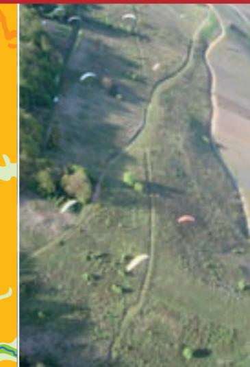
Ausblicke wie diesen muss man sich nach dem Start erst hart erkämpfen!

TIPPS FÜRS FLACHLAND: Auf diese Punkte achtet PWC-Pilot Jens Kierdorf, um Abrisskanten aufzuspüren: